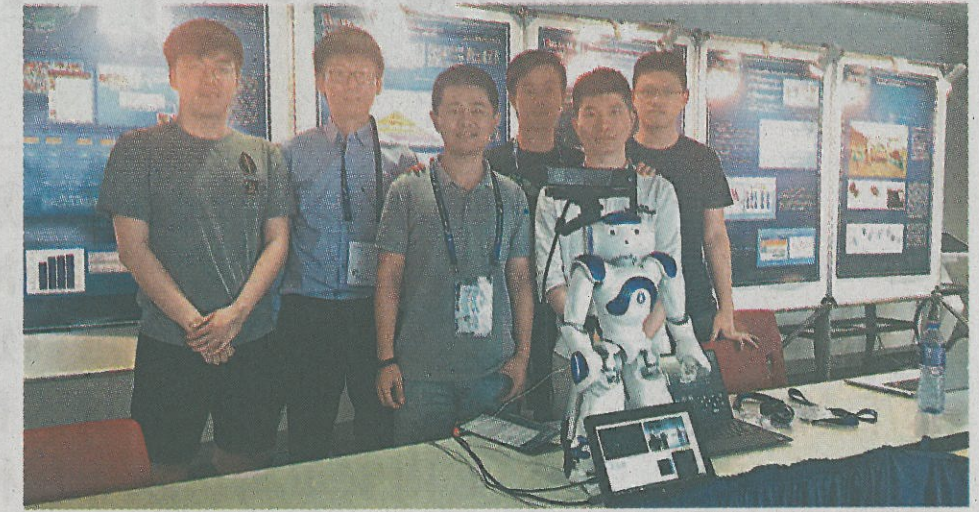
WHAT Lab部分成員。

最後，譚鐵牛展望香港大數據發展，他說：「香港是大數據及人工智能研發理想之地，大數據和人工智能將使香港更智慧、更強大，是香港的希望」，相信大數據在港發展會更蓬勃。